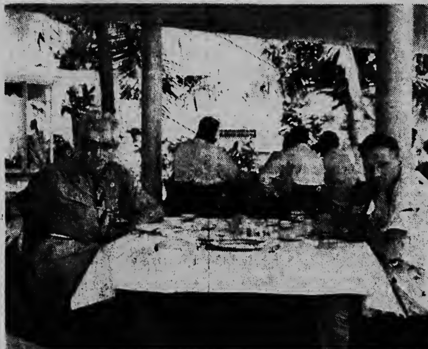
Esaki ta un lunch cu tabatin ofreci na Basi Rutu ofrece door di K.N.S.M. na e pasaheronan na ocasion di e prome viahe di e bapor nobo M/S „Oranje Nassau“.

Comodidad pa e pasaheronan Mescos cu e otro bapornan di pasahero di KNSM, „Oranje Nassau“ ta un bapor di „Een-klasse“ cu lugar pa 116 pasahero. „Een-klasse“ no kier meen awor cu tur e 116 pasaheronan por dispone di tur e comodidadnan, pero solamente e viaheronan singular y familiar nan tin e posibilidad escoge entre e gran cantidad di e camarotenan cu variacion aki (pa un te cuatro persona y un gran cantidad di e camarotenan tin nan propio banjo y w.c.), segun deseo di cada persona. E comodidad cu e pasaheronan ta hanja den dje: E lounge, comedor air-conditioned (ambos ta keda den henter e hanchura di e bapor di manera cu bo ta hanja un vista precioso), sala pa huma, sala pa scirbi, bar y e salon di belleza pa damas y caballeros air-conditioned, ta expresa e confort y ambiente agradable. Tambe e bapor tin un lugar especial pa mucha, bon regla y dushi cu tur modernismo posible. E interior di e bapor aki a ser proyecta pa e architecto. J. A. van Tienhoven, kende ya a llega